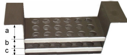
A-11059...A11064 PB 4 - PB 12