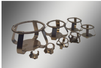
Halteklammern für Kolben in Einsatzkorb SFK